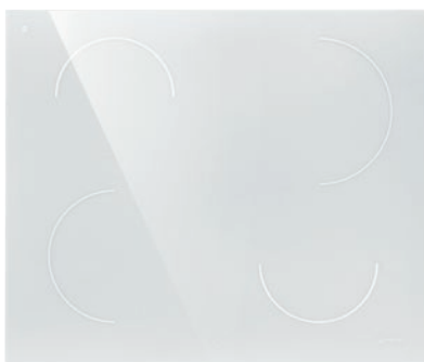
IT 612 SY2W Płyta indukcyjna